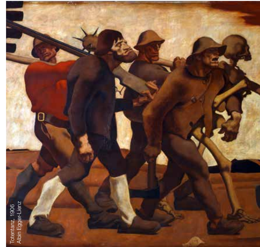
Totentanz, 1906 Albin Egger-Lienz

Osttirol bietet ein interessantes und abwechslungsreiches Angebot an musealen Schauangeboten wie Schloss Bruck oder die Römerstadt Aguntum, hochstehenden Kunst- und Kulturveranstaltungen wie die Matrieier Oper „Gruß an Schloss Weissenstein“ oder das so beliebte „Olala-Straßentheater“ in Lienz. Abgerundet wird das bunte Kulturleben in Osttirol von zahlreichen traditionellen Brauchtumveranstaltungen.