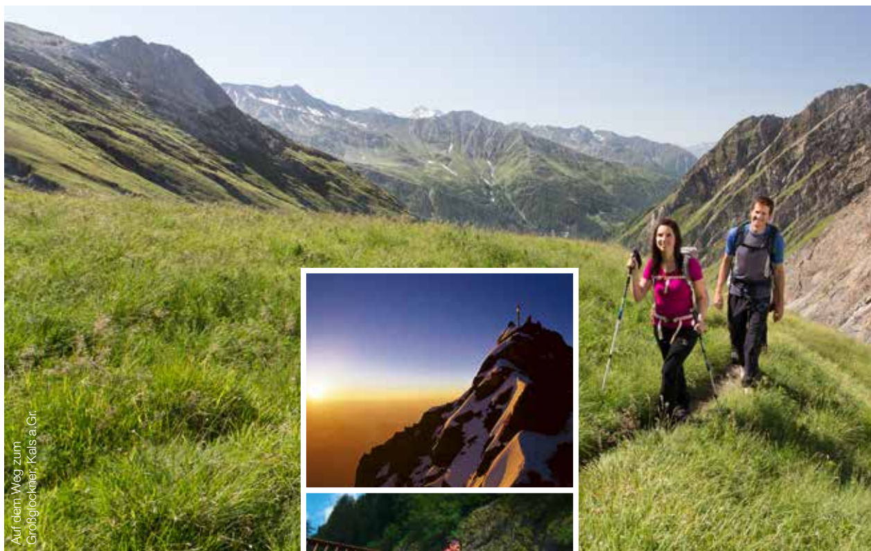
Auf dem Weg zum Großglockner, Kals a.Gr.

Im Herzen des Nationalparks und inmitten eines Meeres aus 241 Dreitausendern liegt der höchste Gipfel Österreichs - „König“ Großglockner mit 3.798 m. Wer sich aufmacht, den Großglockner und das an seinem Fuße gelegene Bergdorf Kals zu erkunden, tritt in die großen Fußstapfen der wagemutigen Erstbesteiger.