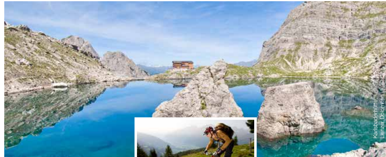
Karlsbaderhütte, Lienzer Dolomiten

Osttirols Bezirkshauptstadt Lienz bietet Eltern und Kindern den ganzen Sommer über Spannung, Spaß und echtes Naturerlebnis mitten in der Bilderbuchlandschaft der Lienzer Dolomiten. Der Osttiroler ist nur eines der Highlights des Ferienprogramms, das die Dolomitenhauptstadt den Sommer über bereithält. Im Erlebnipark Galitzenklamm kann die ganze Familie Action erleben, Genussradler kommen in Osttirol ebenfalls auf ihre Kosten.